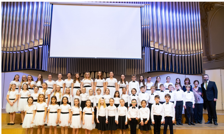
Bratislavský detský zbor na koncerte k 100 výročiu založenia Základnej umeleckej školy Miloša Ruppeldta