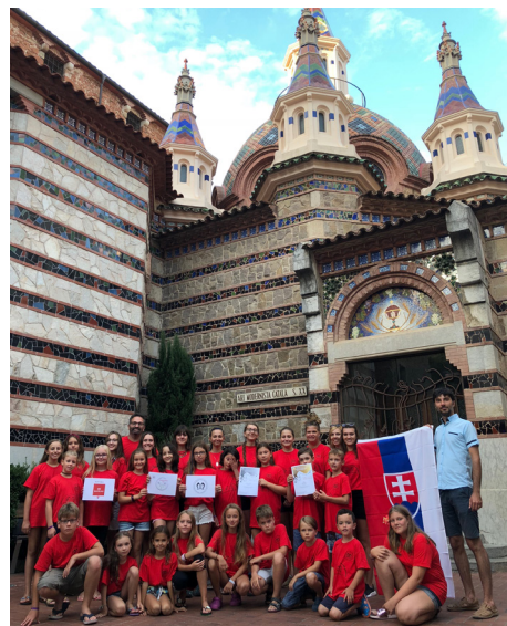
Bratislavský detský zbor na súťaži v Lloret de Mar Barcelone