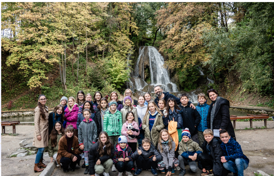
Bratislavský detský zbor na sústreďení v obci Lúčky Kúpele