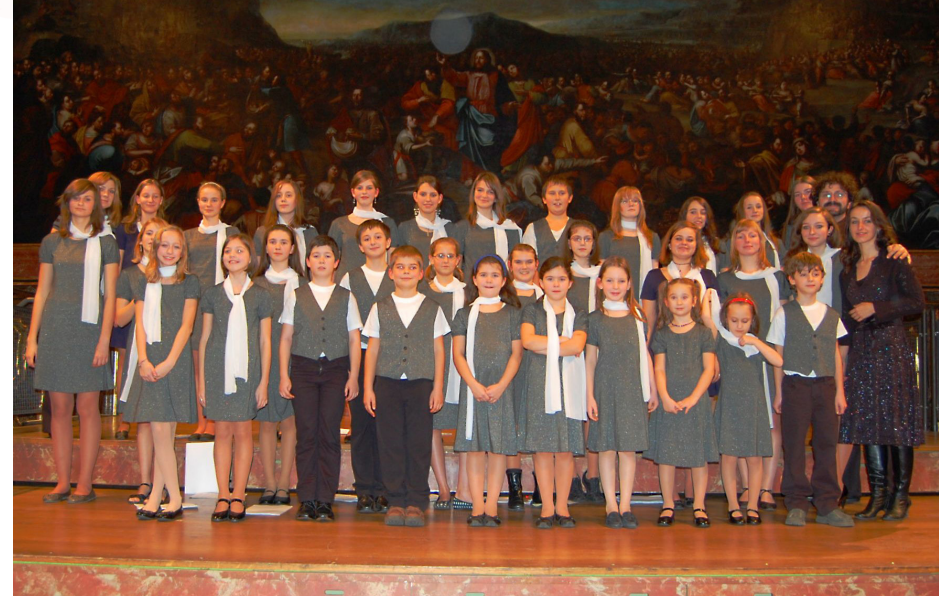
Bratislavský detský zbor na festivale Alpen Adria Advent Konzert v Grazi 2008