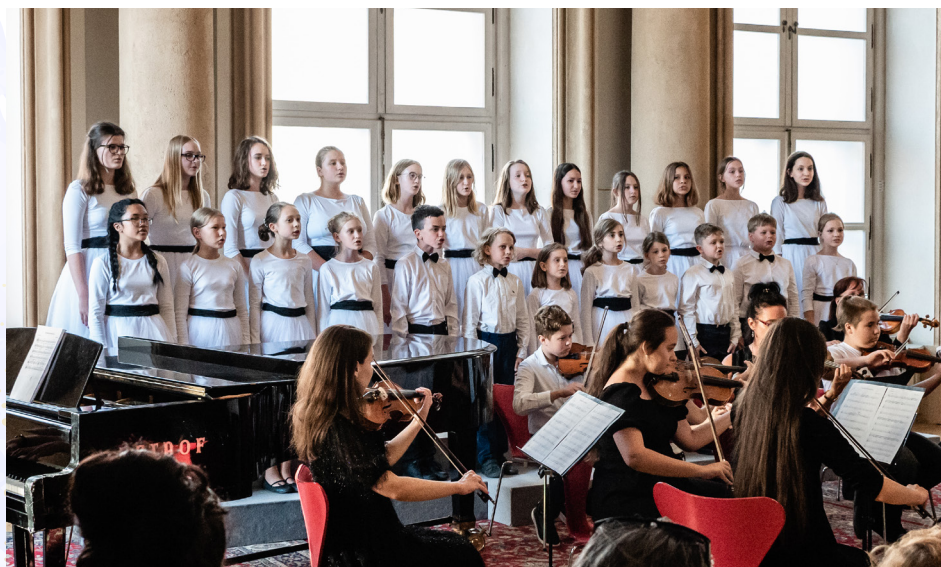
Koncert Bratislavského detského zboru s komorným orchestrom Základnej umeleckej školy Miloša Ruppeldta

Veľmi ma teší, že také krásne jubileum, akým je nesporne 60 rokov Bratislavského detského zboru, môžeme osláviť spolu.