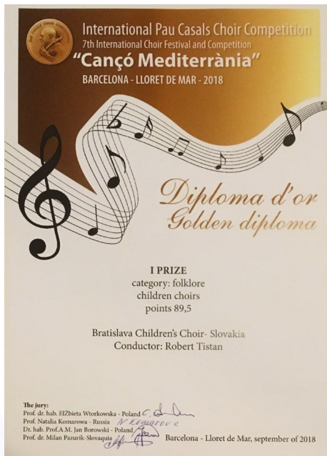
Diplomy z Medzinárodnej súťaže Canco Mediterrania v Lloret deMar