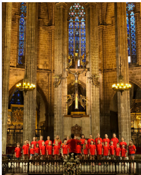
Koncert v katedrále Santa Maria del Mar v Barcelone