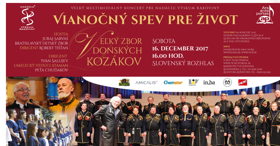
Vianočný koncert Veľkého zboru Donských kozákov a Bratislavského detského zboru