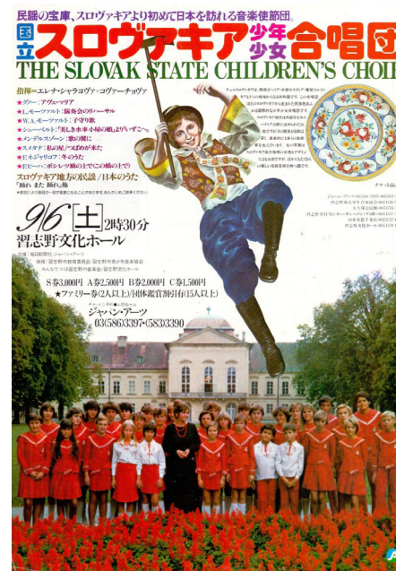
Plagát z turné po Japonsku