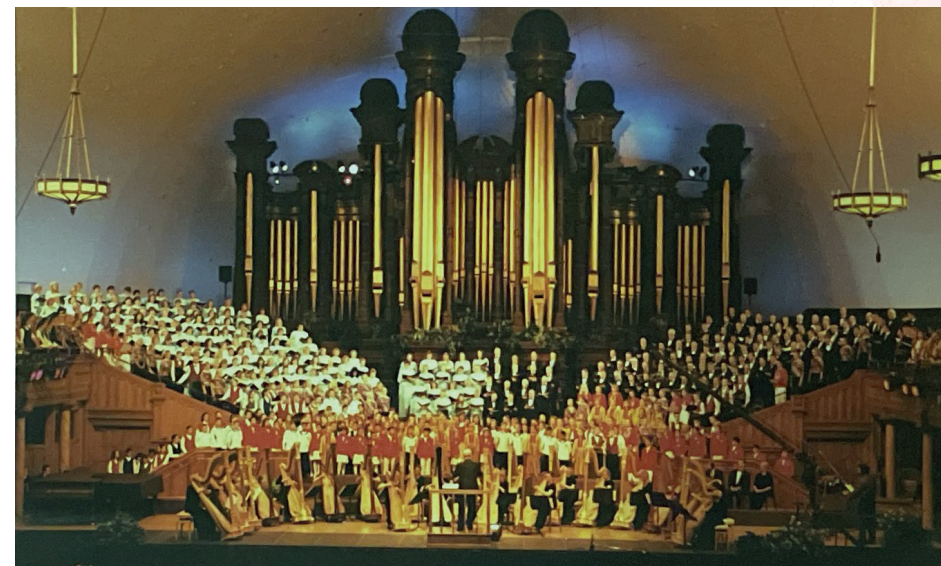
Koncertné turné Bratislavského detského zboru v USA- Salt Lake City 2001